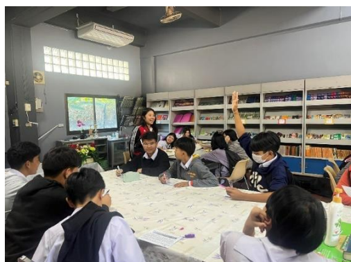
ภาพที่ 1 บรรยากาศในห้องเรียนการอ่านภาษาอังกฤษเพื่อความเข้าใจโดยใช้เทคนิค KWL

จากตารางที่ 1 แสดงผลการเปรียบเทียบความสามารถการอ่านภาษาอังกฤษเพื่อความเข้าใจของนักเรียนชั้นมัธยมศึกษาปีที่ 3 หลังเรียนโดยใช้เทคนิค KWL กับเกณฑ์คะแนนร้อยละ 80 สรุปได้ว่านักเรียนที่ผ่านเกณฑ์การทดสอบจำนวน 39 คน คิดเป็นร้อยละ 88.72 และจำนวนนักเรียนที่ไม่ผ่านเกณฑ์การทดสอบ 5 คน คิดเป็นร้อยละ 11.28 ซึ่งผลความสามารถการอ่านภาษาอังกฤษเพื่อความเข้าใจมีคะแนนเฉลี่ย 17.54 คิดเป็นร้อยละ 87.70 ซึ่งสูงกว่าเกณฑ์ร้อยละ 80 ตามที่กำหนดไว้